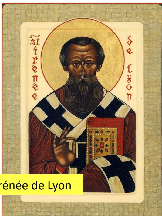
Irénée de Lyon

Le christianisme progresse dans l'Empire romain. Il y a une progression numérique : le nombre des chrétiens augmente, mais il y a, aussi, une progression qualitative : apparaît une littérature chrétienne et déjà de grands auteurs. Nous découvrirons trois grandes figures : saint Ignace, évêque d'Antioche et martyr à Rome, saint Justin, philosophe et martyr et saint Irénée, évêque de Lyon et premier grand théologien de l'Eglise.