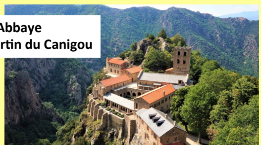
Abbaye Saint-Martin du Canigou

la moitié de la chlamyde dont il avait couvert le pauvre. Il est invité à considérer très attentivement le Seigneur et à reconnaître le vêtement qu'il avait donné. Puis il entend Jésus dire d'une voix éclatante à la foule des anges qui se tiennent autour d'eux : « Martin, qui n'est encore que catéchumène, m'a couvert de ce vêtement. » En vérité le Seigneur se souvenait de ses paroles, lui qui avait proclamé jadis : Chaque fois que vous avez fait quelque chose pour l'un de ces tout-petits, c'est pour moi que vous l'avez fait , quand il déclara avoir été vêtu en la personne de ce pauvre. Et pour confirmer son témoignage en faveur d'un si bonne œuvre, il daigna se faire voir dans le même habit que le pauvre avait reçu. Cette vision n'exalta pas un orgueil tout humain chez notre bienheureux, mais il reconnut dans son œuvre la bonté de Dieu et comme il avait dix-huit ans il s'empressa de se faire baptiser.